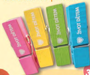
Magnetický kolíček (na výběr různé barvy)