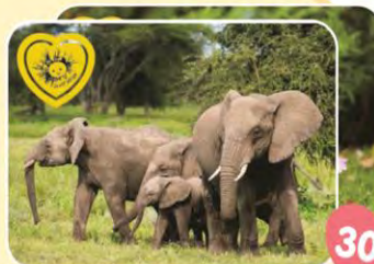
Magnetka se zvířátky 8x6 cm (na výběr různé obrázky)