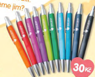
Propisovací tužka (na výběr různé barvy)