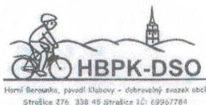
ing. Lukáš Fišer předseda DSO HBPK

Připomínky k závěrečnému účtu DSO mohou občané uplatnit písemně ve lhůtě do 12. 6. 2018 do 14,00 hod. na adresu Obecní úřad Dobřív, Dobřív 305, 338 44 Dobřív nebo ústně na sněmu, kde bude závěrečný účet projednáván.